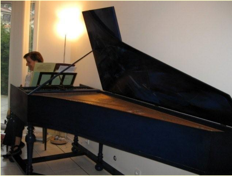
La musique très agréable.